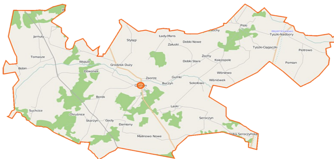
Rysunek 1. Mapa Gminy Czerwin.

Na terenie Gminy Czerwin znajduje się 45 sołectw.